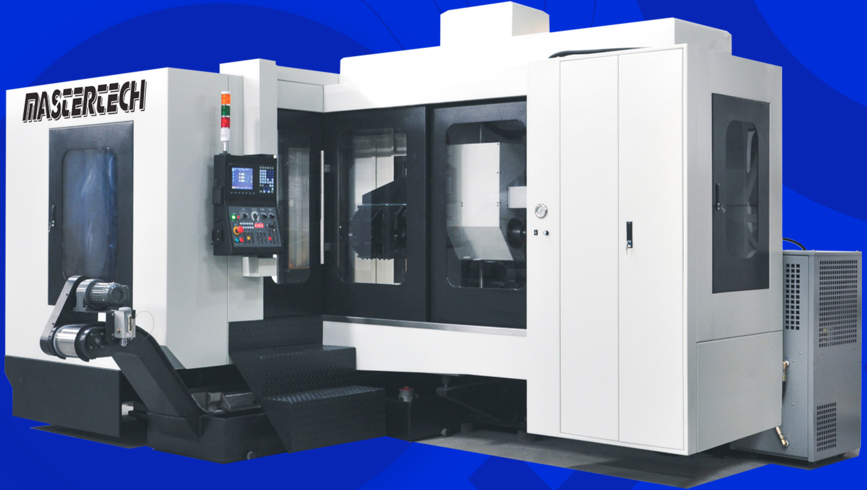
NCS-1300 CNC Derin Delik Delme Tezgahı