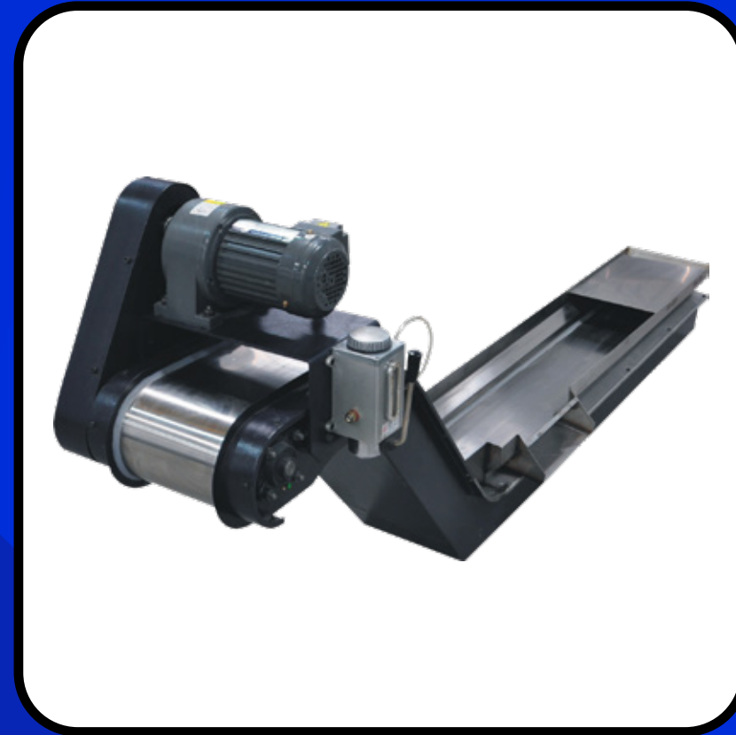
Paletli Tip Konveyör