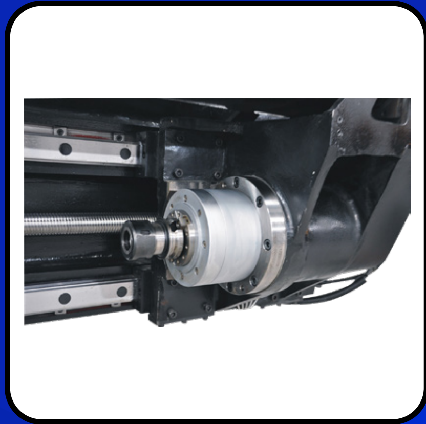
İş Mili Takım Tutucu