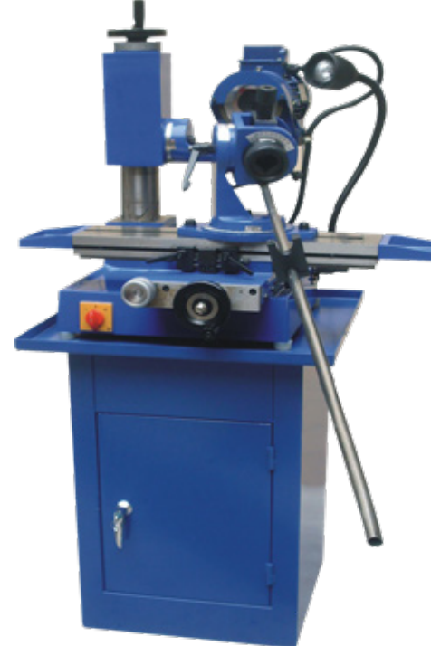
Paletli Tip Konveyör