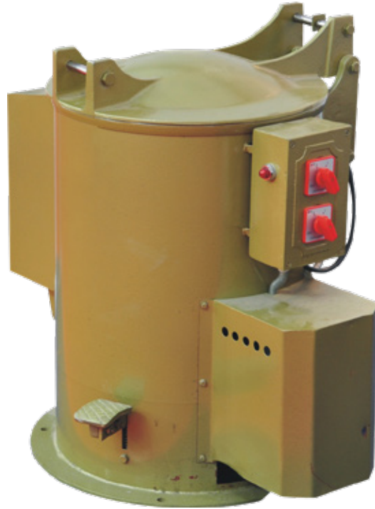
Yağ Sıyırıcı Sistem